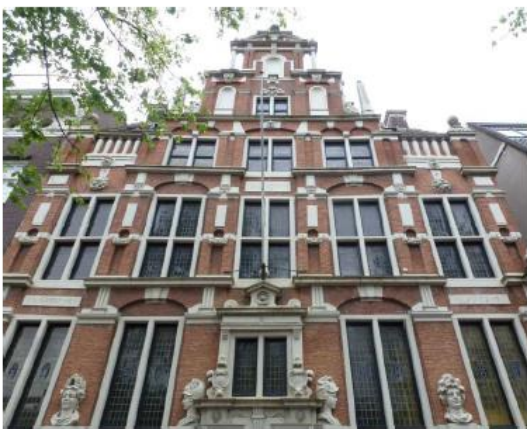
Trippenhuis en Huis met de hoofden, Amsterdam